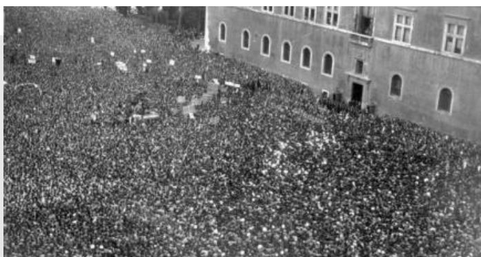
Dichiarazione di guerra a Piazza Venezia (10 giugno 1940)