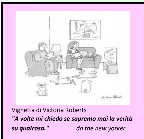
Vignetta di Victoria Roberts "A volte mi chiedo se sapremo mai la verità su qualcosa." da the new yorker

Quello che bisogna cercare, è una fusione di interessi dei popoli europei e non solamente il "mantenimento" dell'equilibrio di questi interessi.